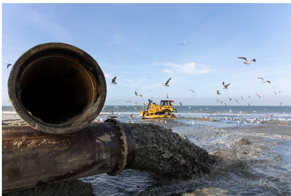
Figuur 1. Uitvoering van een strandsuppletie.

Het suppletieprogramma voor de periode 2024-2027 van het Programma Kustlijnzorg wordt dit jaar (2023) vastgesteld. Vervolgens wordt dit suppletieprogramma jaarlijks geactualiseerd na het meten en beoordelen van de kust. We beoordelen de geprogrammeerde suppleties dan opnieuw en passen deze waar nodig aan. Ook kunnen we nieuwe suppleties aan het programma toevoegen indien daar aanleiding toe is. Gedurende de uitvoering van dit suppletieprogramma brengen we in totaal 40 miljoen m 3 zand aan op de Nederlandse kust a . Het voorliggende programma voor de periode 2024-2027 is nog niet helemaal ingevuld. Daardoor houden we ruimte om het programma de komende jaren verder in te vullen en bij te sturen, bijvoorbeeld naar aanleiding van onvoorziene erosie of voortschrijdend (wetenschappelijk) inzicht.