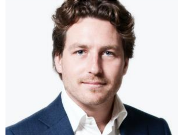
Fractievoorzitter. Algemene Zaken, Openbare Orde & Veiligheid, Bouwen & Wonen, Financien, Toerisme