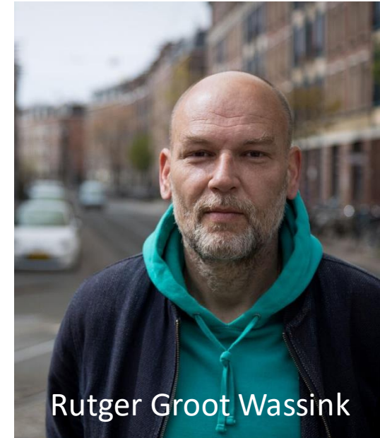
Rutger Groot Wassink

Wethouder Sociale Zaken, Diversiteit en Democratisering