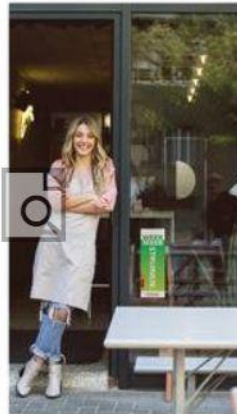
Raamsticker 15x42cm 38,- per stuk (2 stuks: 39,50, 3 stuks 40,75)