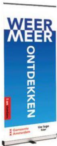
Roll up banner 85 x 200 cm vanaf 30,- per stuk