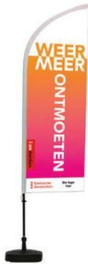
Beachflag 245 cm hoog vanaf 100,- per stuk