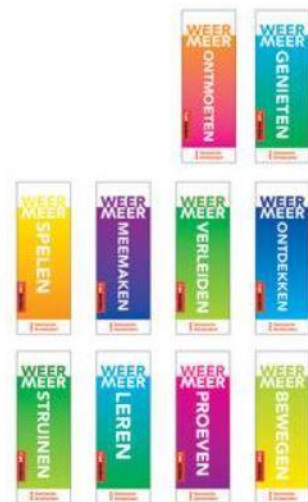
Je kunt een van bovenstaande woorden kiezen én een van bovenstaande kleuren die je daarbij wilt gebruiken.

Mail de naam van het gewenste product, het woord, de kleur en (bij roll up banner en beachflag) een vector logo van jouw instelling/bedrijf naar brand@iamsterdam.com . Je ontvangt binnen 3 werkdagen een pdf waarmee je een bestelling kunt plaatsen op www.drukwerkdeal.nl of www.stickerwinkel.com