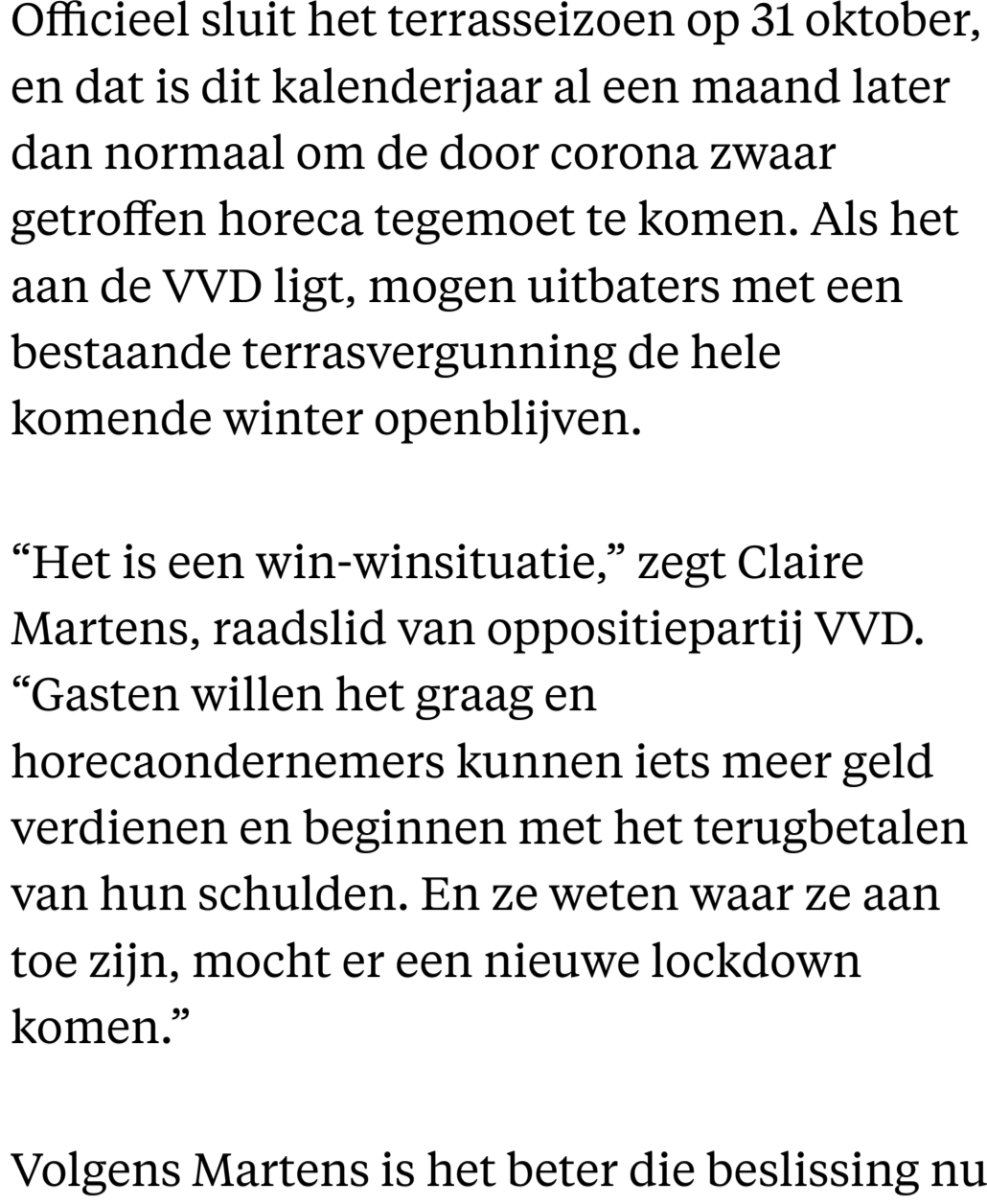
In het plan van de VVD worden alleen bestaande terrasvergunningen verlengd.

Hans Van Der Beek 19 augustus 2021, 16:09